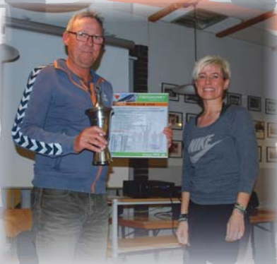
Årets klub 2016 - FAGI