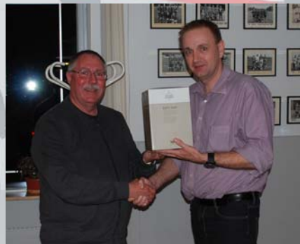
FAGI blev sidste modtager af Årets Pokal Modtager her erstatningspokalen 2016